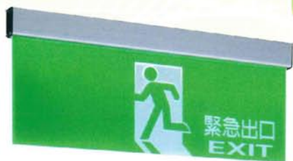
型號規格 BH級 SH-203CSH-EX-L