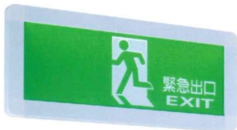
型號規格 BH級 SH-203CSH-F-EX-L