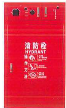
B2-5 暗箱面版加緊急電源