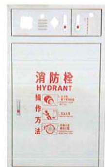
B2-10 暗箱面版加緊急電源